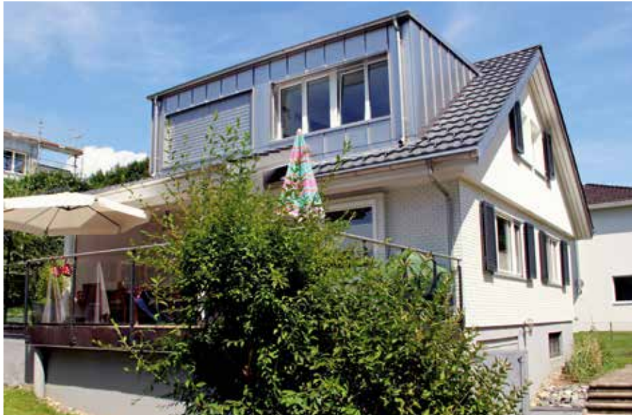
Auch von aussen erfuhr das Einfamilienhaus dank neuen Ziegeln und neuem Verputz eine positive Veränderung.

und so neu drei gleich grosse Zimmer sowie eine Nasszelle mit WC und Dusche zu schaffen. Dafür wurden zuerst sämtliche Verkleidungen innen und aussen am Dach demontiert und die bestehende Dachkonstruktion für die neuen Bauteile angepasst. Anschliessend montierte man die im Werk des Holzbau-Unternehmens vorgefertigten Elemente wie Innenwände oder auch Gauben inklusive fertig eingebauter Fenster.