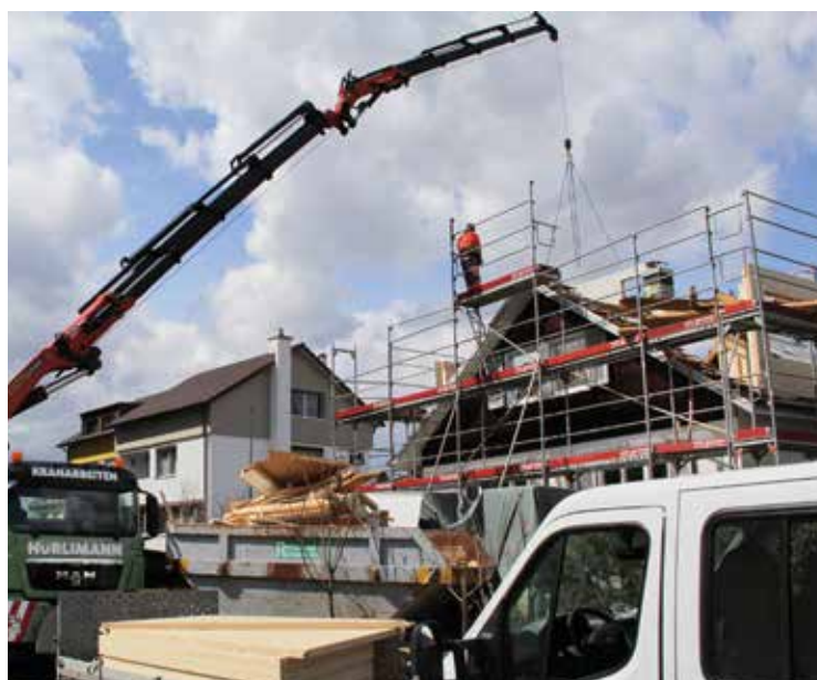
Die Holzelemente wie Gauben oder Trennwände wurden bereits im Werk der Walter Kälin Holzbau AG vorgefertigt und zur Montage angeliefert, was einiges an Zeitersparnis einbrachte.